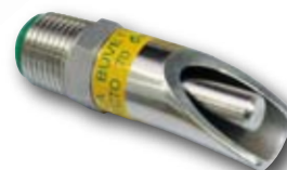
Directo 70 Post-sevrage