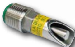
Directo 50 Pour porcelets

La nouvelle gamme directo est la seule gamme de sucettes au monde dont le flux d'eau est continu dans le sens de l'ouverture, ce qui limite les turbulences et réduit considérablement les gaspillages.