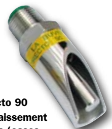
Directo 90 Engraissement truies (cases maternités et gestantes) et verrats

► Prix et accessoires dans le nouveau catalogue La Buvette PORC 2008